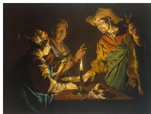
Esaü et Jacob—Matthias Stom

Entrée tout public : 15 €, adhérents 10 €, gratuit pour étudiants et religieux.