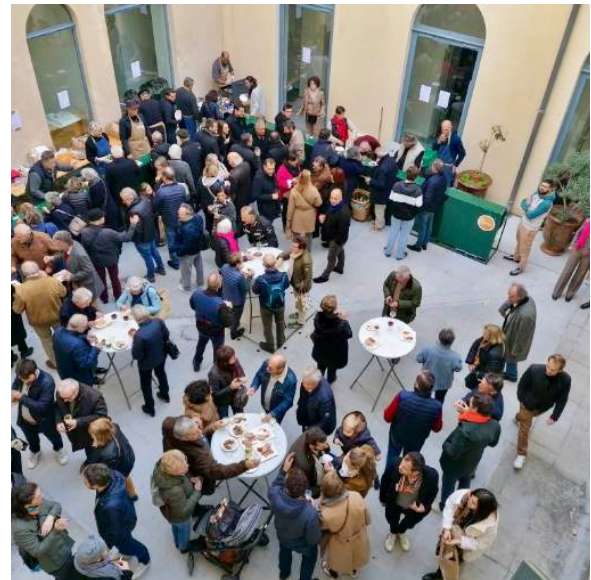
Patio MdP Kermesse 2022

Vendredi et samedi de 10h à 18h à la MdP : salon de thé , comptoir salé ; vendredi : espace « Accueil repas » pour se retrouver en petits groupes ; samedi midi : Tapas à la MdP ; samedi à partir de 16h : crêpes-partie à la MdP.